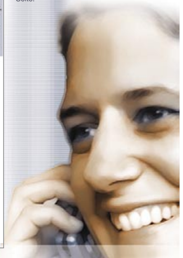
Erstelle Dein Suchprofil

Nun befindest Du Dich in dem Formular, welches hier dargestellt ist. Trage die von Dir gewünschten Eigenschaften Deines Partners ein. Je genauer Deine Angaben sind, desto genauer wird Dein Suchergebnis werden. Speichere die Daten mit "speichern" am Ende der Seite.